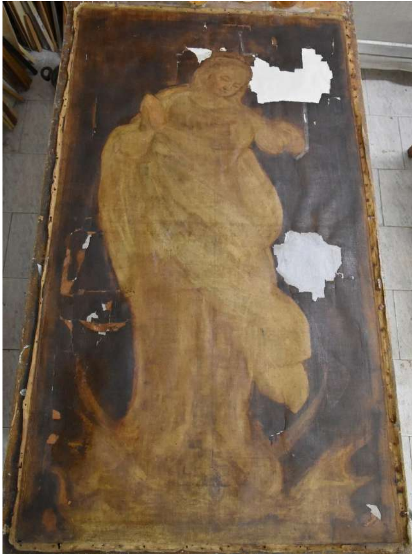
Figura 2 Maestro emiliano, Immacolata Concezione, Chiesa di San Biagio di Maranello, anni 30-40 del XVII secolo, verso (prima del restauro)

Ma perché un'opera così antica si trova all'interno di una chiesa così recente? Per scoprirlo dobbiamo risalire a un documento del 1375 (conservato presso il monastero di Marola, in provincia di Reggio Emilia) attestante l'esistenza del castello di Maranello. In questo castello si trovava infatti la chiesa di San Biagio, santo patrono tuttora venerato e a cui è consacrata l'attuale chiesa di Maranello, costruita tra il 1895 e il 1903 nella posizione in cui si trova attualmente 2 .