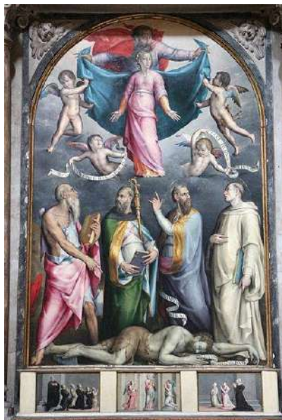
Figura 11 Pierfrancesco di Jacopo Foschi, Disputa sulla Immacolata Concezione , 1544-46, chiesa di Santo Spirito, Firenze.