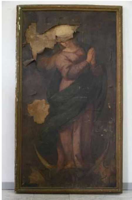
Figura 1 Maestro emiliano, Immacolata Concezione , Chiesa di San Biagio di Maranello, anni 30-40 del XVII secolo, 174.5 x 98.5 cm (prima del restauro)