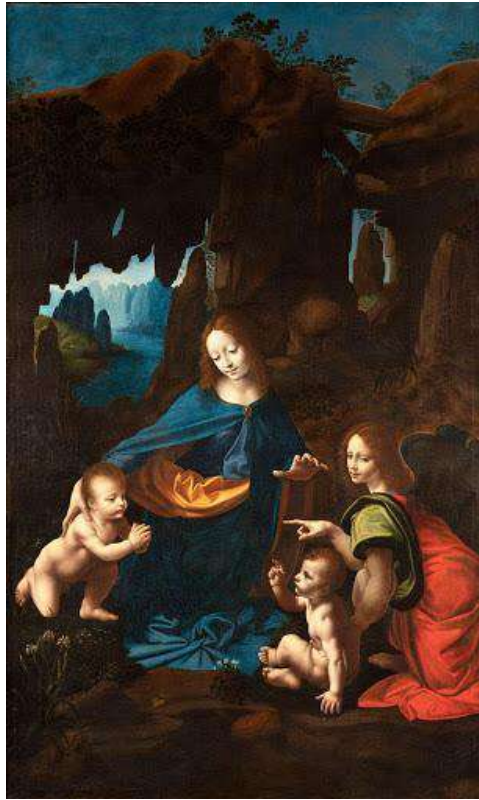
Figura 9 Leonardo, Vergine delle Rocce, 1483-86, Museo del Louvre, Parigi

Il 25 aprile del 1483, Bartolomeo Scorigione, priore della Confraternita milanese dell'Immacolata Concezione (una confraternita laica maschile), stipulò un contratto per una pala da collocare sull'altare della cappella della Confraternita nella chiesa di San Francesco Grande (oggi distrutta) col giovane artista arrivato circa un anno prima da Firenze. Per Leonardo era la prima commissione che otteneva a Milano.