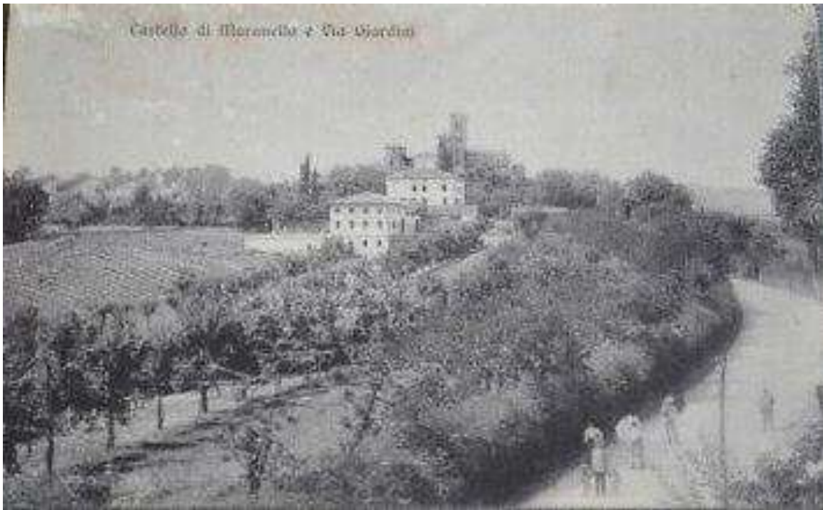
Figura 4 La nuova via Giardini e il Castello di Maranello.

Dunque per motivi di sicurezza e soprattutto di comodità dei fedeli, costretti a percorrere quotidianamente una ripida salita per partecipare alle messe, fu chiesto al duca il permesso di costruire un nuovo edificio in pianura, in particolare nella zona che poi verrà denominata Maranello nuova. La nuova chiesa si trova infatti tra Via Giardini, Via Claudia e Via Trebbo.