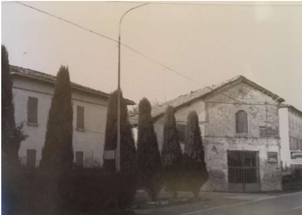
Figura 5 Antica chiesa della Madonna del Corso di Maranello, fotografia del dopoguerra da via Claudia.