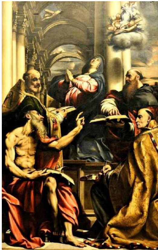
Figura 10 Il Pordenone, Disputa dei Padri della Chiesa sull'Immacolata Concezione, 1539, Pinacoteca Nazionale Capodimonte, Napoli.

Un'altra opera molto significativa che esprime il delicato momento storico riguardante questo dogma è la pala di Jacopo Foschi, conservata in Santo Spirito a Firenze (fig.11). Sopra le tre scene della predella vediamo un uomo steso, esame, a terra. E' il primo uomo, Adamo, morto a conseguenza del peccato. Sopra il suo cadavere ci sono quattro teologi (da sinistra a destra San Girolamo, Sant'Agostino, Sant'Anselmo e San Bernardo di Chiaravalle). Maria invece è rivestita da Dio Padre di un manto celeste, allusione della natura umana rivestita dall'alto di attributi soprannaturali.