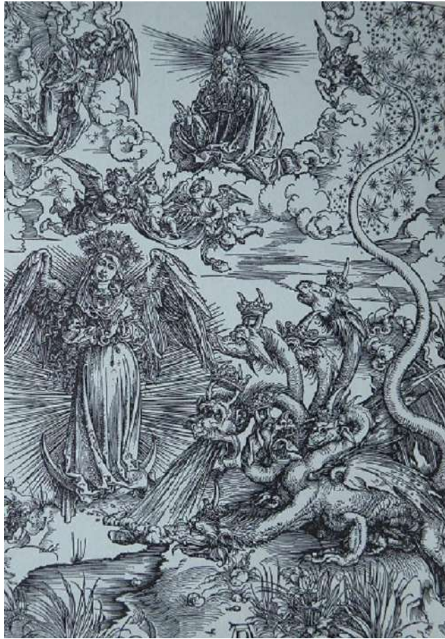
Figura 12 A. Durer, La donna vestita di luce e il drago a sette teste , 1496-98

Nel '600, durante il periodo della Controriforma si crea una nuova immagine dell'Immacolata Concezione, particolari e soggetti che ritroveremo anche nel dipinto di Maranello. Tali caratteristiche sono quelle di una donna apocalittica, vestita di sole, incoronata da dodici stelle e appoggiata su una luna. La Madonna è raffigurata giovane, con le mani giunte al petto, il mantello azzurro e la luna crescente, simbolo di castità, e spesso il cordone francescano a tre nodi. Questa versione rimarrà una delle versioni più significative all'interno della storia dell'arte. Una delle opere più caratteristiche e rappresentative è quella di Guido Reni (fig. 13) databile al 1627 e del secolo successivo quella di Giambattista Tiepolo del 1768 (fig. 14), in cui notiamo come la raffigurazione dell'Immacolata abbia raggiunto il suo massimo splendore e il suo pieno significato.