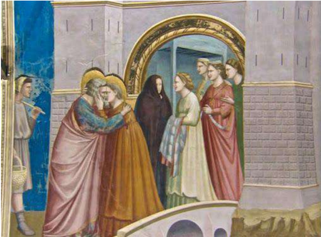
Figura 7 Giotto, Incontro di Anna e Gioacchino alla Porta d'Oro , 1303-05, Cappella degli Scrovegni, Padova.

Il momento dell'abbraccio/bacio tra i due sposi, secondo gli scrittori medievali, segnò il momento dell'Immacolata Concezione di Maria: «...ecco dunque che Gioacchino giunse con le sue greggi; e Anna stava sulla porta e vedendolo arrivare gli corse incontro e si appese al suo collo, dicendo: "ora so che il Signore Iddio mi ha grandemente benedetta...e che io vedova non sono più vedova, io senza figli concepirò nel mio ventre 6 ».