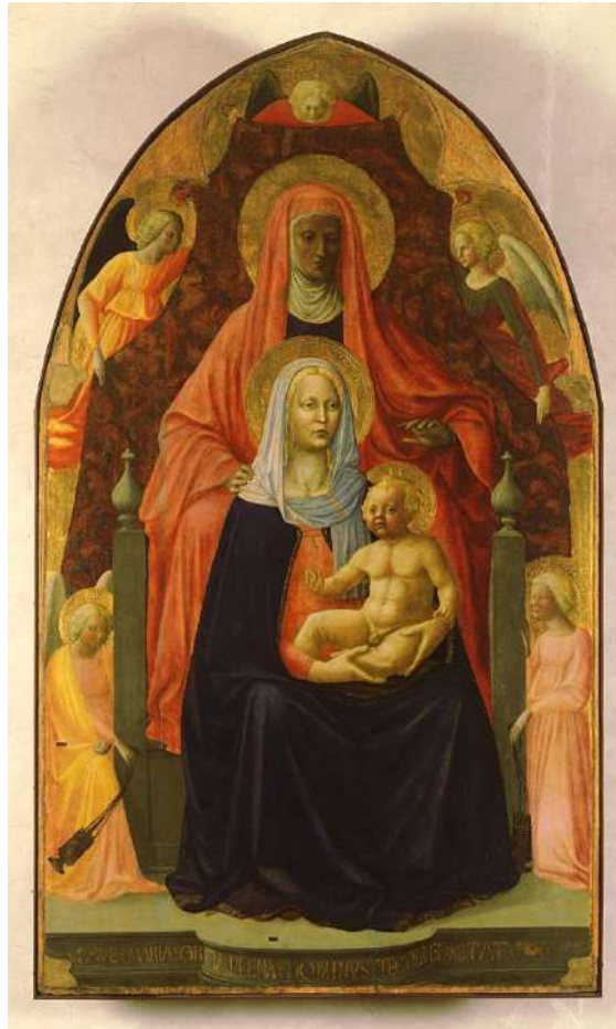
Figura 8 Masaccio e Masolino, Sant'Anna Metterza, 1424-1425, Galleria degli Uffizi, Firenze

Insieme all'opera di Masolino e Masaccio dobbiamo senza dubbio citare la "Vergine delle rocce" (1483), opera di Leonardo, anch'essa una degna raffigurazione che tocca il tema dell'Immacolata, una giovane Vergine che esprime la purezza e la grazia del suo animo (fig. 9).