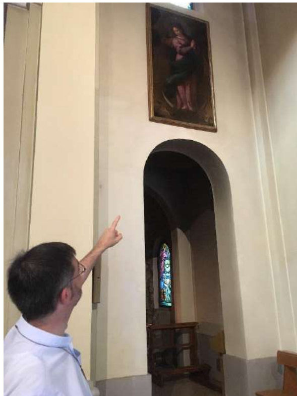
Figura 15 posizione attuale dell'Immacolata Concezione di Maranello.

L'Immacolata Concezione è raffigurata in questo dipinto al centro della scena quasi a grandezza naturale. Indossa un lungo abito di colore rosa, ricamato finemente nella zona degli avambracci, un mantello verde che si posa sulla spalla sinistra e che cade lungo le vesti fasciandola interamente nella parte corrispondente al ventre, come a significare il suo essere "immacolata". La pesantezza delle vesti è sottolineata da un panneggio corposo che copre interamente il corpo della Vergine, facendola sembrare pesante e ferma come una colonna e sottolineando maggiormente la forza che doveva avere per affossare il male terreno presente sotto ai suoi piedi. Il volto, dolce e delicato, è una delle parti più significative e meglio eseguite a livello pittorico e conferisce al dipinto un senso di armonia