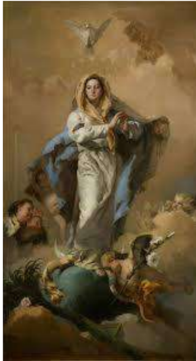
Figura 14 G. B. Tiepolo, L'Immacolata Concezione , 1768, Museo del Prado, Madrid.

Da Immacolata Ideale a Immacolata Concezione: