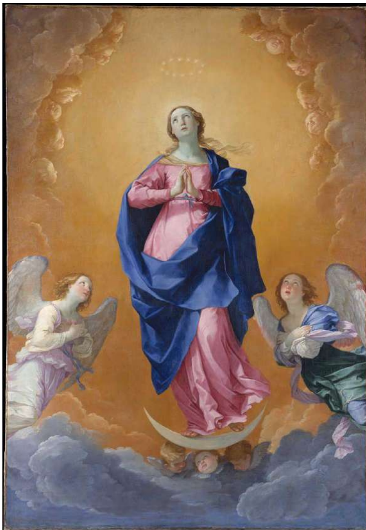
Figura 13 G. Reni, L'Immacolata Concezione, 1627, MET Museum.