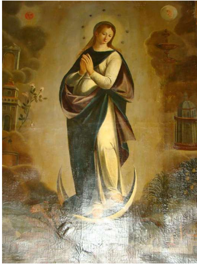
Figura 16 Maestro piemontese, Immacolata Concezione, XVII secolo, chiesa di S. Maria Assunta, Ozzano Monferrato

Lo schema compositivo di questo dipinto, seppur di due scuole differenti (una piemontese e una emiliana), si avvicina molto alla tela di Maranello e raffigura una giovane Maria che dall'alto piomba improvvisamente sulla terra e, piena di grazia, schiaccia il drago sotto ai suoi piedi.